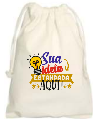
SAQUINHOS ALGODÃO CRU