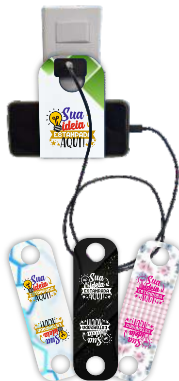
SUPORE CARREGADOR DE CELULAR