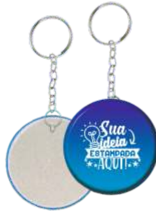
CHAVEIRO SIMPLES 3,5CM