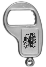
CHAVEIRO ABRIDOR 3X1 (1 LADO)