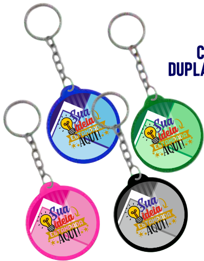
CHAVEIRO DUPLA FACE 3,5CM