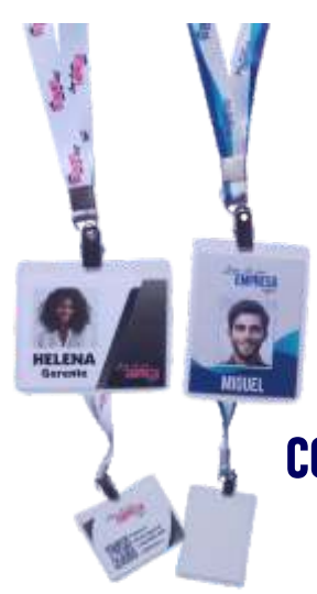
CRACHÁ COM TIRANTE