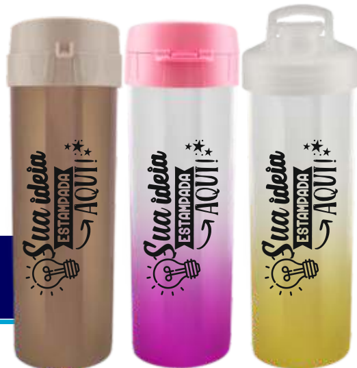
GARRAFA ÁCQUA BIO 475ML METALIZADA