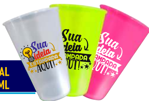
COPO ECO TRADICIONAL 550ML

ATENÇÃO: CASO NÃO HAJA ESTOQUE DISPONÍVEL, A QUANTIDADE MÍNIMA PARA REALIZAR PEDIDO NO FORNECEDOR É 50!