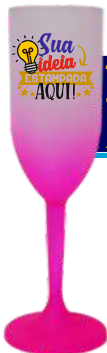
TAÇA CHAMPANHE 190ML JATEADA DEGRADÊ