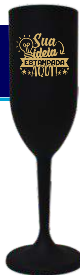
TAÇA CHAMPANHE 190ML PRETA FOSCA