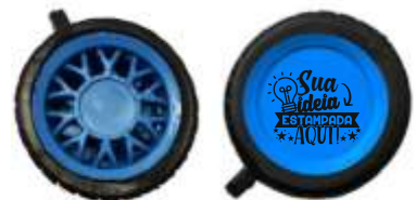
CHAVEIRO PNEU (1 LADO)