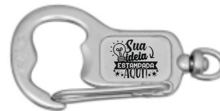
CHAVEIRO MOSQUETÃO ABRIDOR RETANGULAR ESTRELA (2 LADOS)