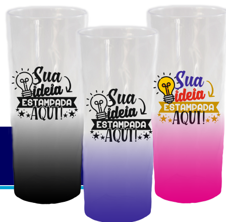
LONG DRINK 350ML TRANSPARENTE DEGRADÊ