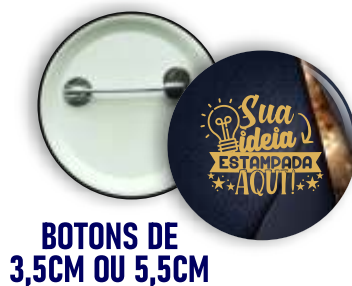
BOTONS DE 3,5CM OU 5,5CM