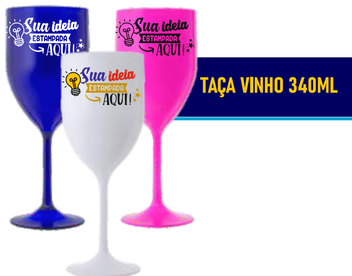
TAÇA VINHO 340ML