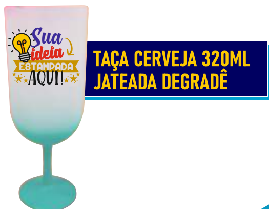
TAÇA CERVEJA 320ML JATEADA DEGRADÊ