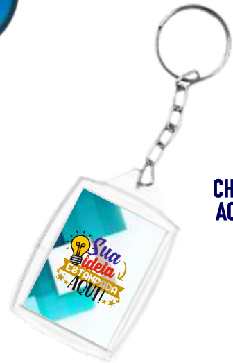
CHAVEIRO ACRILICO 3X4