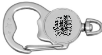
CHAVEIRO MOSQUETÃO ABRIDOR REDONDO ESTRELA (2 LADOS)