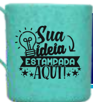
CANECA ECOLÓGICA 400ML