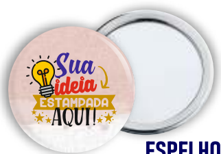
ESPELHO DE BOLSA 5,5CM

QUANTIDADE MÍNIMA E PRAZO DE ENTREGA A COMBINAR