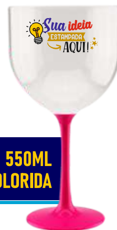
TAÇA GIN 550ML BASE COLORIDA