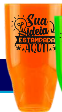
COPO DRAFT 430ML