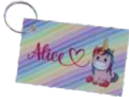
TAG PARA MOCHILA OU ESTOJO