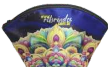
NECESSAIRE MEIA LUA