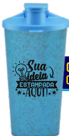
COPO ECOLÓGICO 600ML COM TAMPA SHAKE

MODELOS DISPONÍVEIS: COPOS ECOLÓGICOS 250ML, 400ML E 600ML