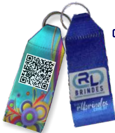
CHAVEIRO DE TIRA