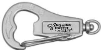
CHAVEIRO MOSQUETÃO ABRIDOR RETANGULAR ESTRELA (2 LADOS)