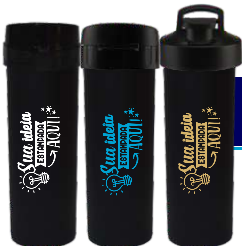
GARRAFA ÁCQUA BIO 475ML PRETA FOSCA