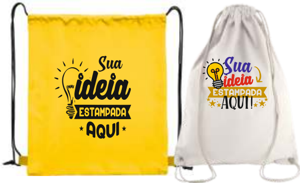
SACOCILA POLIÉSTER, NYLON OU ALGODÃO CRU 20X30CM OU 30X40CM