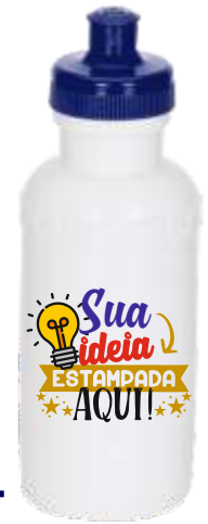
SQUEEZE PLÁSTICA 500ML

QUANTIDADE MÍNIMA E PRAZO DE ENTREGA A COMBINAR