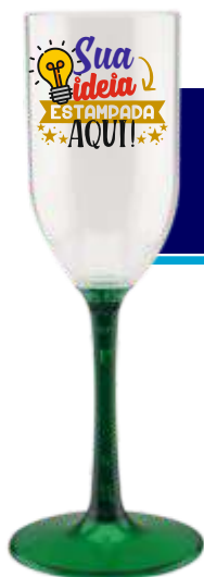
TAÇA CHAMPANHE 190ML BASE COLORIDA