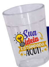
SHOT TRADICIONAL 50ML