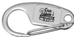
CHAVEIRO MOSQUETÃO ANZOL (2 LADOS)