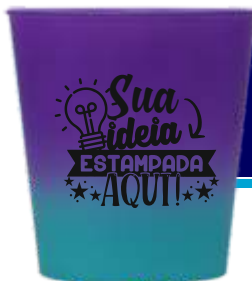
COPO ECOLÓGICO 250ML DEGRADÊ