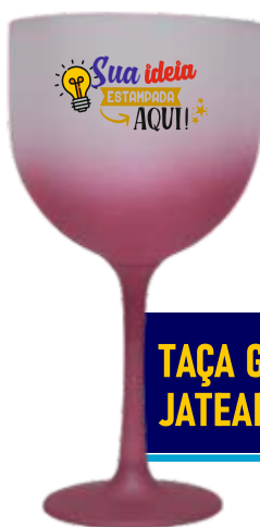
TAÇA GIN 550ML JATEADA DEGRADÊ