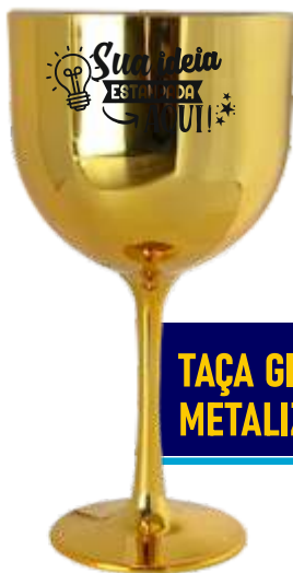
TAÇA GIN 550ML METALIZADA