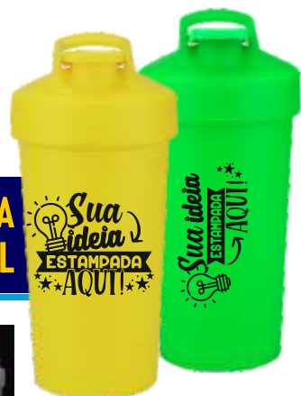
SHAKEIRA ECOLÓGICA 750ML