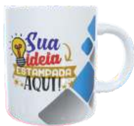
CANECA CERÂMICA 325ML