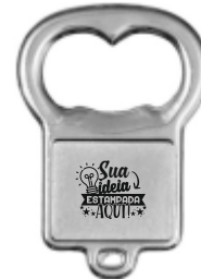
CHAVEIRO ABRIDOR (1 LADO)