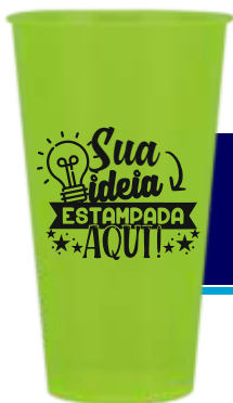
COPO ECOLÓGICO 450ML ECO BEER