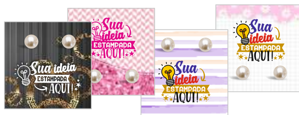
CARTELA DE BRINCO PÉROLA (CARTELA 5X5CM E BRINCO 8MM)