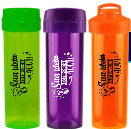
GARRAFA ÁCQUA BIO 475ML