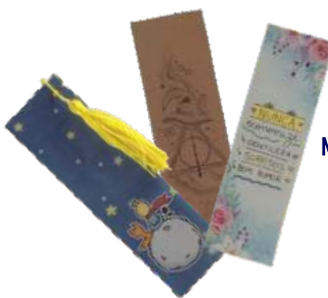
MARCADOR DE PÁGINA