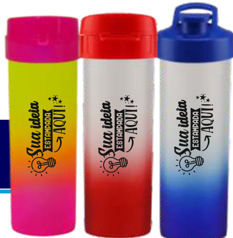
GARRAFA ÁCQUA BIO 475ML JATEADA DEGRADÊ