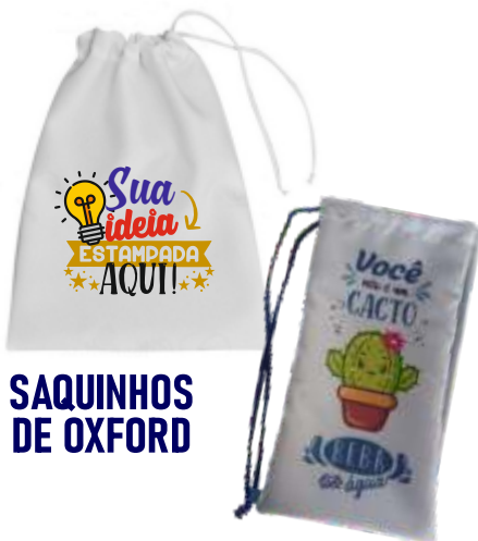
SAQUINHOS DE OXFORD