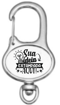
CHAVEIRO MOSQUETÃO OVAL (2 LADOS)