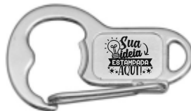
CHAVEIRO MOSQUETÃO ABRIDOR RETANGULAR (2 LADOS)