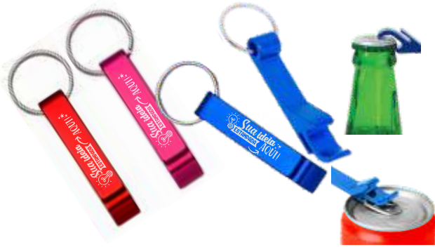
CHAVEIRO ABRIDOR GRAVAÇÃO A LASER