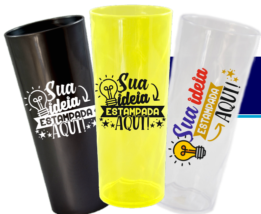
LONG DRINK 350ML