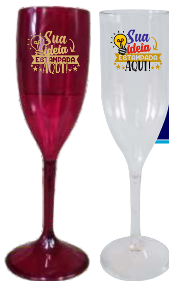
TAÇA CHAMPANHE 190ML