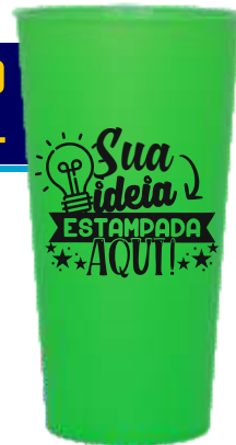
COPO ECOLÓGICO 600ML