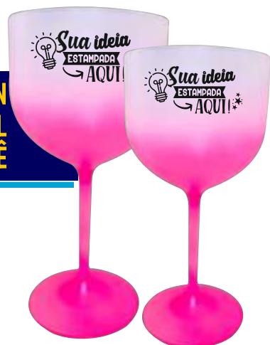
TAÇA GIN 450ML OU 580ML JATEADA DEGRADÊ