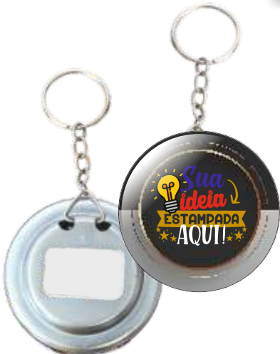
CHAVEIRO ABRIDOR 5,5CM