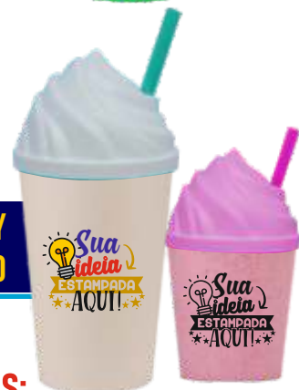
TAMPA CHANTILY COM CANUDO