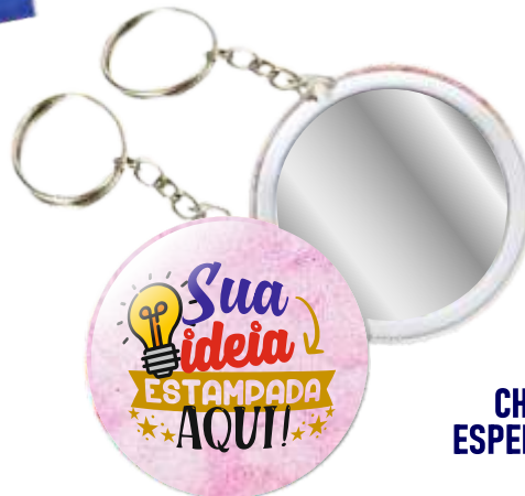
CHAVEIRO ESPELHO 5,5CM

ATENÇÃO: CASO NÃO HAJA ESTOQUE DISPONÍVEL, A QUANTIDADE MÍNIMA PARA REALIZAR PEDIDO NO FORNECEDOR É 50!