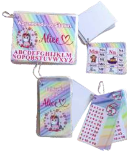
CHAVEIRO SILABAS OU TABUADA