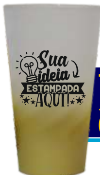
TWISTER 550ML JATEADO DEGRADÊ (OPÇÃO COM BORDA)

TODAS ESSES ITENS TEM A OPÇÃO DE BORDA METALIZADA