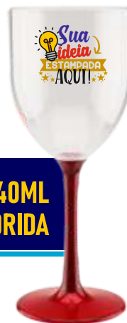
TAÇA VINHO 340ML BASE COLORIDA