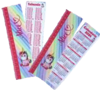
RÉGUA TABUADA OU CALENDARIO