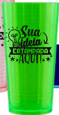
COPO PIXEL 450ML