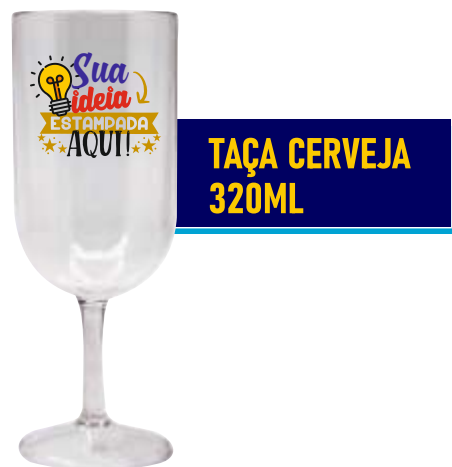
TAÇA CERVEJA 320ML