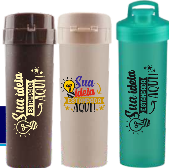
GARRAFA ÁCQUA BIO 475ML ECOLÓGICA