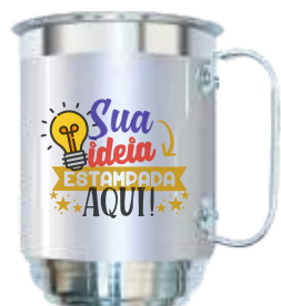
CANECA ALUMÍNIO 400, 500 OU 600ML