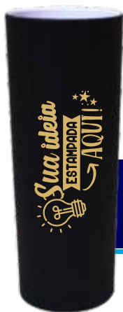
MINI LONG DRINK 250ML PRETO FOSCO