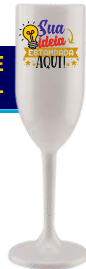
TAÇA CHAMPANHE 190ML