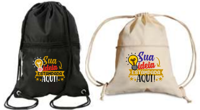
SACOCILA COM BOLSO, POLIÉSTER, NYLON OU ALGODÃO CRU 35X45CM