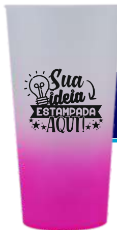
COPO ECOLÓGICO 600ML DEGRADÊ