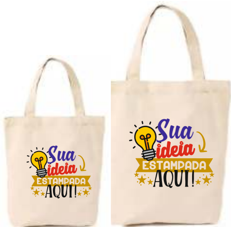
25X35CM 35X45CM ECOBAG ALGODÃO