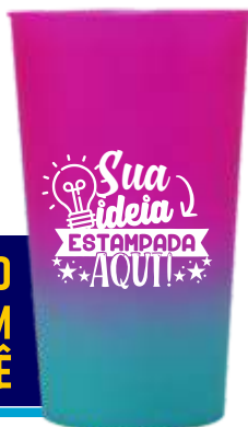
COPO ECOLÓGICO 400ML SLIM DEGRADÊ