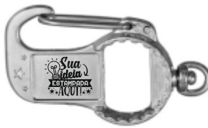
CHAVEIRO MOSQUETÃO ABRIDOR 2X1 ESTRELA (2 LADOS)