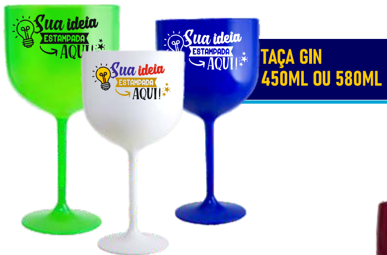
TAÇA GIN 450ML OU 580ML