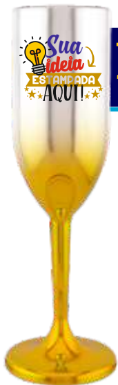
TAÇA CHAMPANHE 190ML METALIZADA