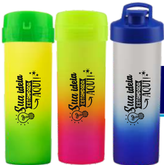
GARRAFA ÁCQUA BIO 475ML ECOLÓGICA DEGRADÊ