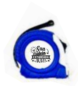
CHAVEIRO TRENA 1M (2 LADOS)