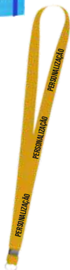
TIRANTE LISO OU PERSONALIZADO