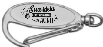
CHAVEIRO MOSQUETÃO OVAL 2 (2 LADOS)