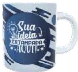
CANECA POLÍMERO 300ML