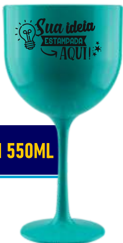
TAÇA GIN 550ML