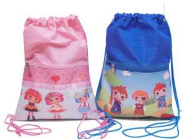
SACOCILA OXFORD COM ZIPER 28X44CM