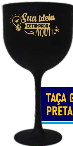
TAÇA GIN 550ML PRETA FOSCA