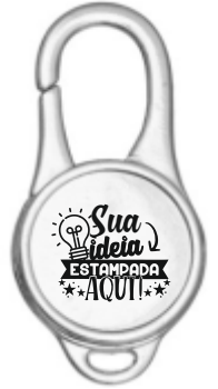
CHAVEIRO MOSQUETÃO CADEADO (1 LADO)